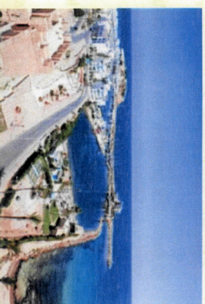
La ville de Monastir